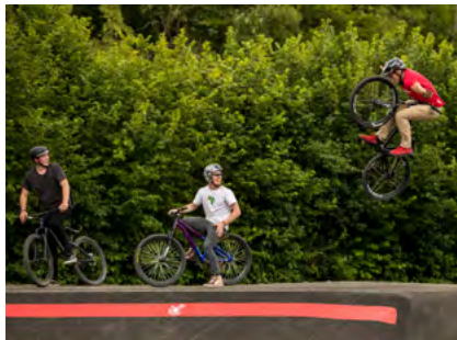
Auf Initiative vom Kinderrat: Pumptrack in Frauenfeld / Unser Beitrag: 5'000.- Fr.