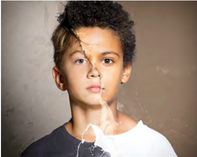
Beziehung und Zusammenarbeit: Wie gestalten?

Finanziell stehen wir auf guten Beinen und sind von Jahr zu Jahr mit den kantonalen Ämtern und Behörden sowie den in den Kantonen tätigen Institutionen, wie der tarjv im Thurgau, besser vernetzt.