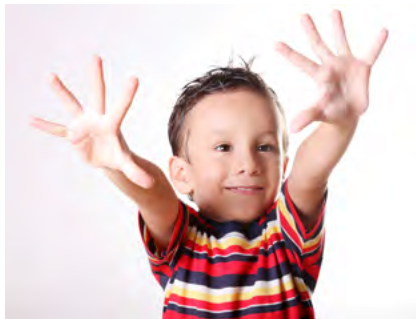
Zehn Jahre Pro Juventute Verein