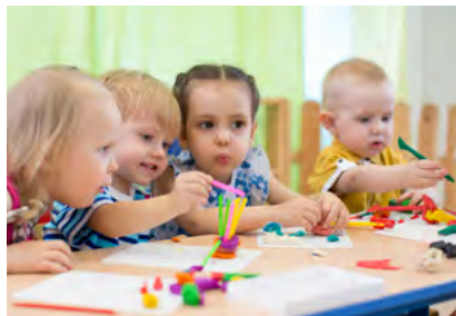
Viele Beiträge gingen an Kitas