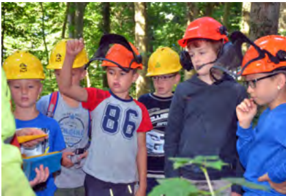
Mit Förster und Forstwart im Wald