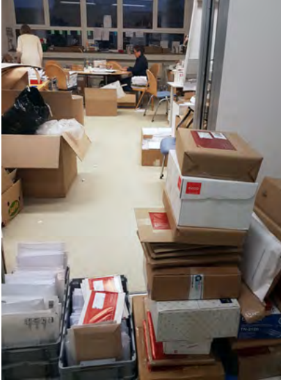
Die DVK Schlacht