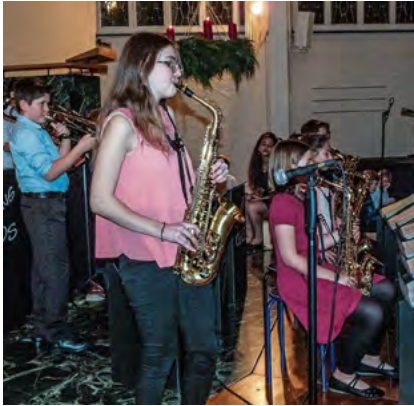
Swing Kids Konzert Arbon

Am Sonntag, 3. Dezember und Samstag, 16. Dezember 2017 fanden die vorerst letzten beiden Weihnachtskonzerte mit Dai Kimoto & his Swing Kids in Frauenfeld und Arbon statt.