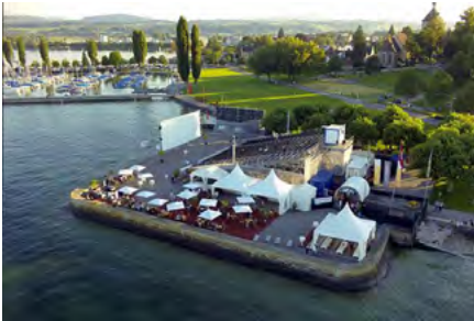
Open Air Kino Arbon

Viele Kinobesucher stellten Fragen und erzählten ihre persönlichen Geschichten im Zusammenhang mit Pro Juventute. Es entstanden spannende und offene Gespräche. Solche Begegnungen sind immer wieder bereichernd und zeigen die Anliegen und Interesse unserer Gesellschaft auf.