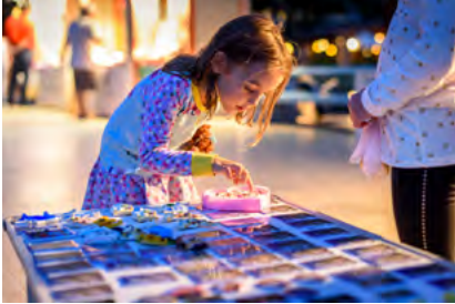
Flohmarkt in Schlatt

Schluss übrig war, durften die Kinder bzw. Mamis dem SOS-Kinderdorf spenden.