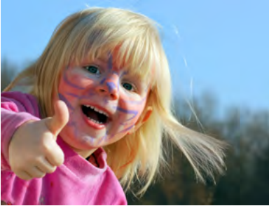
Spielstrassenfest auf dem Boulevard in Kreuzlingen