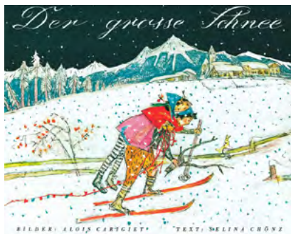
Beliebte Kinderbücher als Weihnachtsgeschenk mit dem Spendenplus

Das DVK-Team legt viel Wert auf die Auswahl der Artikel. Es sind nebst den Marken und der Vignette möglichst Geschenkartikel, die in der Region Ostschweiz hergestellt werden. Die Arbeitsgruppe besucht dafür Weihnachts- und Koffermärkte, geht an Messen wie die Schlaraffia in Weinfelden, informiert sich über Neuigkeiten in Zeitungen und Journalen und recherchiert intensiv im Internet.