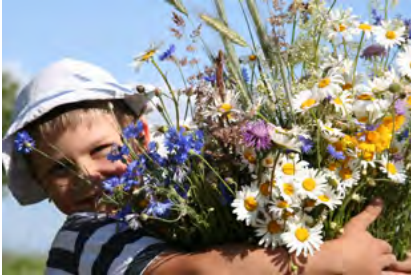
Bunter Strauss an Angeboten für die Jugend in der Region