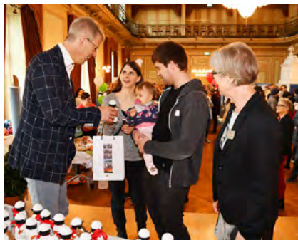
Babyempfang in Frauenfeld