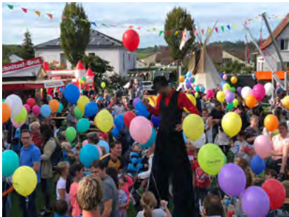
Kinderfest in Bischofszell