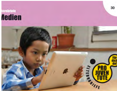
Pro Juventute Elternbriefe

Für die Thurgauer Gemeinden Berg, Bürglen, Märstetten, Weinfelden und Wigoltingen übernimmt die Sektion Weinfelden seit vielen Jahren den altersgerechten Versand der Elternbriefe. So ist gewährleistet, dass zum Beispiel im ersten Lebensjahr monatlich punktgenau auf den aktuellen Entwicklungsstand des Kindes ein Elternbrief im Briefkasten landet.