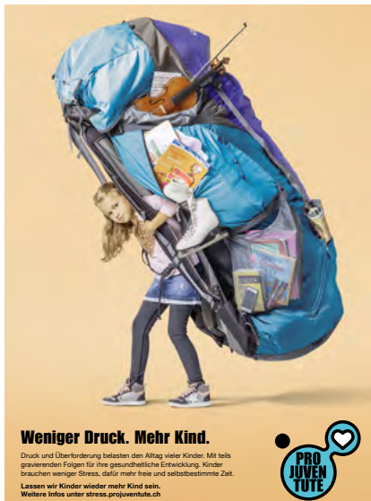
Kampagne „Weniger Druck, Mehr Kind“

Die Stiftung Pro Juventute lanciert regelmässig Kampagnen. Erstmals wurden wir Pro Juventute Vereine im Vorfeld mit einbezogen und befragt, welche Themen wir bzw. die Kinder und Jugendlichen in unserer Region beschäftigen und bewegen. Es kristallisierte sich Ende des Jahres 2017 heraus, dass die beiden Bereiche „psychische Gesundheit“ und „berufliche Chancen“ momentan im Mittelpunkt stehen.