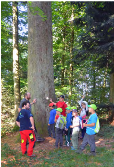
Ferienpass in Steckborn