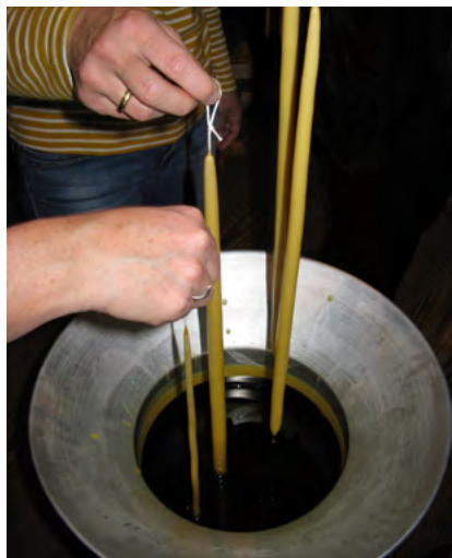
Das Kerzenziehen war ein Grosseerfolg

Auch im 2017 war das Kerzenziehen ein grosser Erfolg. Es waren wieder die ganze Schule Stein am Rhein und Hemishofen dabei. Das grosse Highlight war unbestritten der Spezialeffekt „Eiskristall. Am Freitagabend konnte man wieder die selbstgemachte Kürbissuppe geniessen und neu auch zusätzlich noch Bienenwachskerzen ziehen. Über 200 Kilogramm Wachs wurde gebraucht, um schöne Kerzen zu ziehen. Ebenfalls in der Altra in Schaffhausen wurden eifrig Kerzen gezogen. Viele positive Rückmeldungen seitens der Kinder, der Eltern und der Lehrer durften wir wieder entgegennehmen.