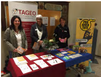
Stand an der Elbi-Expo