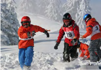
Beiträge an Lager

Armut gibt es auch in der Schweiz - vom Umfeld oft unerkannt, denn aus Scham verbergen die Betroffenen zu knappe Finanzen. Die Kinder laden keine Schulkameradinnen nach Hause ein, erfinden Ausreden, wenn sie keine Ferienerlebnisse erzählen können. Sie schieben Desinteresse am Musikunterricht oder Kinobesuch als Begründung für die Nichtteilnahme vor. Nicht selten schafft das Wahrnehmen und gleichzeitige Verleugern von Wünschen und Bedürfnissen Frustrationen, Aggressionen und einen dauernden sozialen Stress für die Kinder.