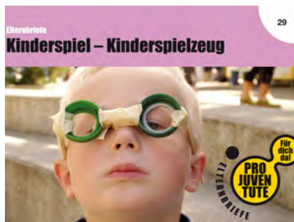
Pro Juventute Elternbriefe

Die Pro Juventute Elternbriefe sind seit über 40 Jahren eine wichtige Stütze für schweizweit mehr als 65'000 Mütter und Väter, die zum ersten Mal Eltern werden.