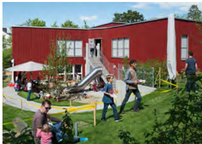
Beitrag an die KiTa Bärenhöhle