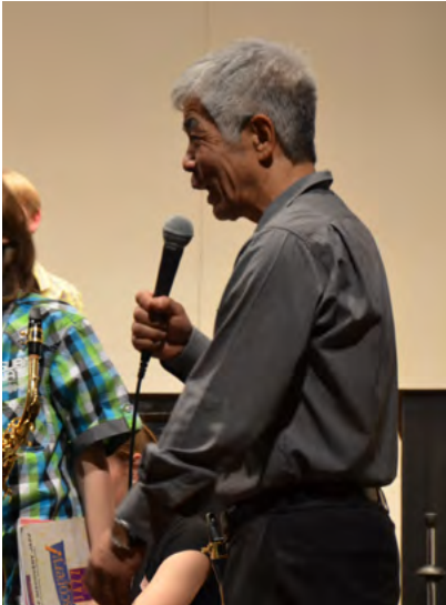
Wir danken auch Dai Kimoto