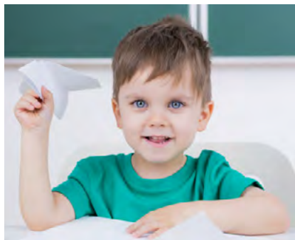
Papierkram gehört dazu