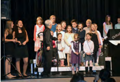
Konzerte 2016 Dai Kimoto & hisSwingKids