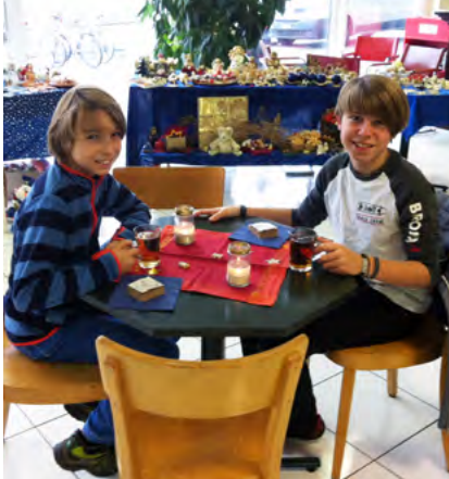
Helfer an der Weihnachtsschmuckbörse

In Hüttwilen engagierte sich eine Klasse mit einem Stand am Schulhaus-Markt und verkaufte ebenfalls Produkte unseres DVK-Sortiments.