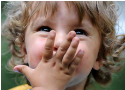
Ein riesiges Dankeschön