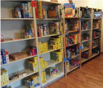
Ludothek Diessenhofen: Pro Juventute ist Gründungsmitglied