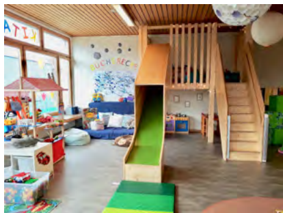
Beitrag an Holzspielhaus der Kita Biberburg in Märstetten