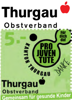
Unser Partner der Spendenaktion Apfelingesäckchen