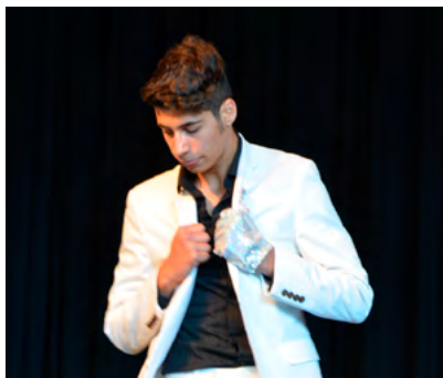
Auftritt Mister Teenie an der Jubiläumsfeier

Wir konnten sieben Familien unterstützen mit Mitgliederbeiträgen für den Sportverein, Musikunterricht, Maltherapie usw. Auch unterstützen wir wiederum Projekte in Schulen und Vereinen wie zum Beispiel ein Spielgerät für die Primarschule Mettlen, Kinderkonzerte der Musikschule, die Zauberlaterne und das Familienzentrum, um nur einige zu nennen.