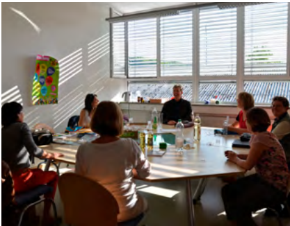
Sitzungs- und Lagerraum in Steckborn

an: „Spenden Sie fünf Franken für die Jugend im Thurgau und wir schenken Ihnen ein Säckchen mit im Thurgau getrockneten Apfelingesäckchen.“