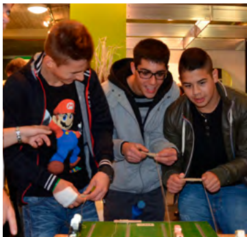
Aktionstag an der Wega „Generationsolidarität“