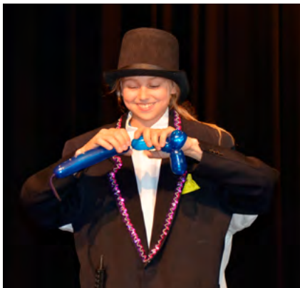
100 Jahre Jubiläum Kreuzlingen