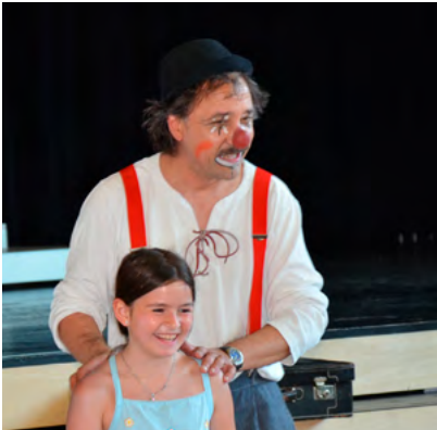
Jubiläumsfeier: Clown Pepe mit Helferin Helfer

Durch die grosszügige Unterstützung durch Firmen, zahlreiche Privatpersonen, die Gemeinden, viele Klassen mit ihren Lehrpersonen sowie andere Organisationen konnten wir uns auch im vergangenen Jahr wieder für Kinder und Jugendliche in der Region (Romanshorn, Salmsach, Uttwil, Kesswil, Dozwil, Sommeri und Hefenhofen) stark machen. Für das uns entgegengebrachte Vertrauen möchten wir uns ganz herzlich bedanken!