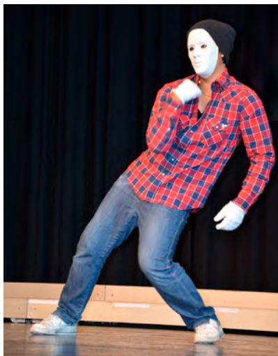
Mister Teeni, Jubiläum

rien war wieder ein voller Erfolg! Aus rund 100 Angeboten konnten die Kinder und Jugendlichen ihr Programm für die nächsten 14 Tage zusammenstellen. Der Ferienpass läuft seit jeher selbsttragend (Sponsoren:TKB, Firma Ströbele). Die Sektion Romanshorn hat vor zwei Jahren beschlossen, dass sie dem Organisationsteam jährlich einen grösseren Geldbetrag zuspricht, damit etwas Spezielles angeboten werden kann. So kam dieses Mal der Walter Zoo aus Gossau mit verschiedenen Tieren. Die Nachfrage nach diesem Angebot war so gross, dass gleich zwei Aufführungen gemacht wurden.