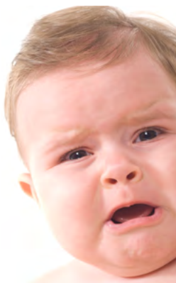
Das emotionale, dritte Vereinsjahr

Den Kinderschuh ist der Verein Pro Juventute Thurgau im dritten Jahr noch nicht entwachsen.