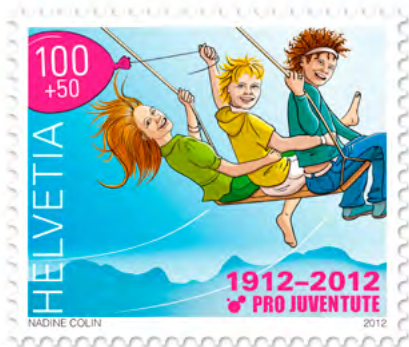
Die 100 Rappen Jubiläumsmarke