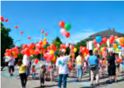
Ballonwettfliegen, Abschluss Jubiläumsfeier