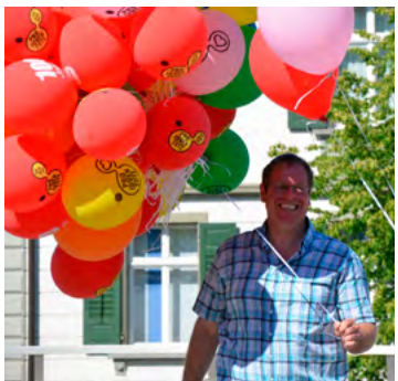
Helfer am Jubiläum