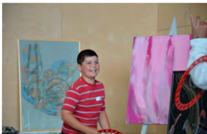
100 Jahre Jubiläum Kreuzlingen