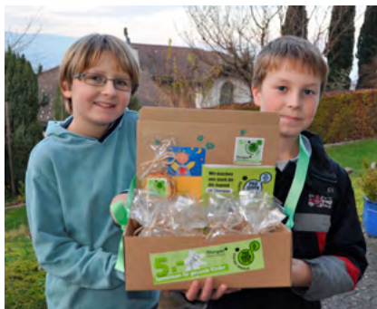
Apfelringverkäufer in Mammern

gen Helferinnen und Helfern sowie Jugendlichen vom Sekretariat in Steckborn aus. Zu Beginn hatten wir dank den Vorbereitungsarbeiten alles gut im Griff. Dann aber hat uns die Menge der Bestellungen Lieferfristen von bis zu vier Wochen beschert, was verständlicherweise zu Reklamationen führte. Engpass war die zwar gute, aber nicht netzwerkfähige Rechnungs- und Buchungssoftware, die nicht das hielt, was versprochen wurde (Mehrplatzfähigkeit). Sie produzierte zusätzlich viele Programmabstürze, die teils bis zu einem Tag an Behebungsarbeiten erforderten.