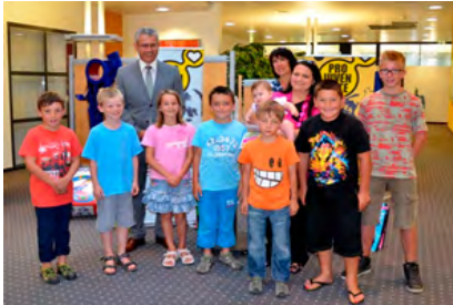
Preisverleihung in der TKB Filiale in Kreuzlingen

Die geplante Benefizauktion musste auch wegen mangelnder Besucher auf den Frühling 2013 verschoben werden. Als Projektleiterin ist es mir wichtig, dass wir den von den 17 Thurgauer Künstlern geschenkten 26 Kunstobjekte einen würdigen Rahmen geben, damit sie versteigert werden können, und darum wird derzeit an einem neuen Konzept gearbeitet. An dieser Stelle möchte ich den 17 Künstlern und allen Sponsoren nochmals herzlich danken.