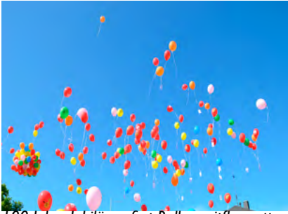
100 Jahre Jubiläumsfest Ballonweitflugwettbewerb,

nenden und sehr abwechslungsreichen Tag.