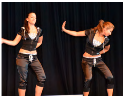
Stepptanz Miss Teenie, Jubiläum