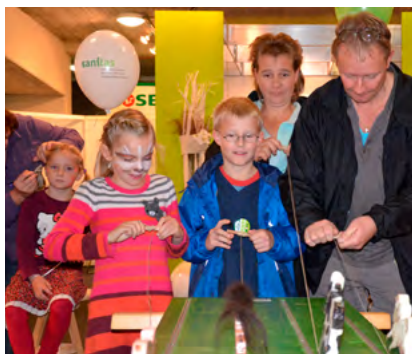
Aktionstag an der Wega „Generationensolidarität