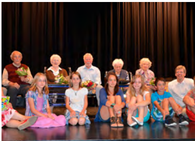
Ausschnitt der Podiumsteilnehmer, Jubiläum